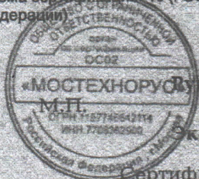
Схема сертификации: 1с (ГОСТ Р 53603-2020 Оценка соответствия. Схемы сертификации продукции в Российской Федерации)